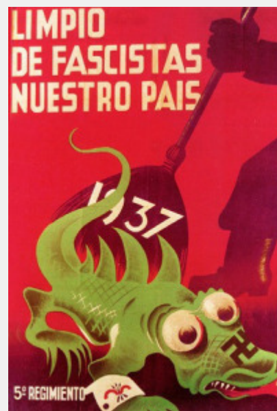
ΑΝΤΙΦΑΣΙΣΤΙΚΗ ΑΦΙΣΑ ΤΟΥ ΙΣΠΑΝΙΚΟΥ ΕΜΦΥΛΙΟΥ

Όμως, η ιδέα ότι στην μετάβαση προς την λαϊκή εξουσία δεν θα υπάρχουν καπιταλιστικές σχέσεις παραγωγής και καπιταλιστική ανάπτυξη είναι παράλογη. Θα ήταν ένας σκέτος αριστερισμός, αν δεν ήταν, ακόμη χειρότερα, μια ιδέα που πριμοδοτεί το μη σχέδιο -την αδράνεια- την ιδεολογική και κινηματική στασιμότητα, την άγωνα ταυτοτική περιχαράκωση. Ως τέτοια, είναι επικίνδυνη, όπως ακριβώς ήταν η συγκαλυπτική στάση του σταλινισμού, η οποία το 1936 κήρυξε τον «σοσιαλισμό» και την εξαφάνιση των ανταγωνιστικών αντιθέσεων, συγκαλύπτοντας την ταξική εξουσία της γραφειοκρατίας. Όποιος δεν παρουσιάζει καθαρά την κατάσταση, καταλήγει να ενισχύει, σε φάσεις όξυνσης της ταξικής πάλης, τελικά τον ταξικό αντίπαλο.