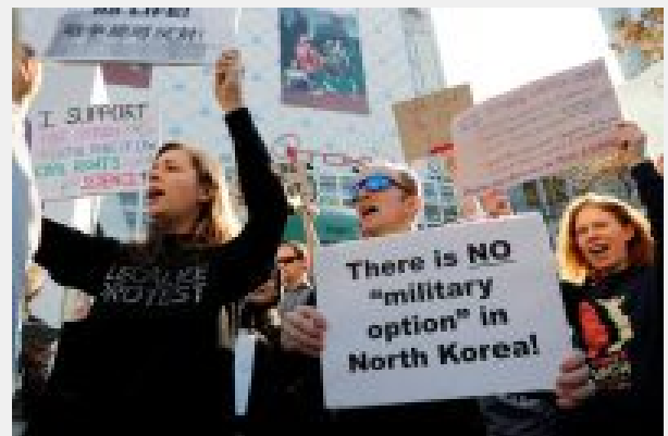
Protesters hold placards at a rally against U.S. President Donald Trump in Tokyo, Japan, November 5, 2017.

Δεν μπορεί να μην επισημάνουμε το θλιβερό κοντράστ εικόνων :