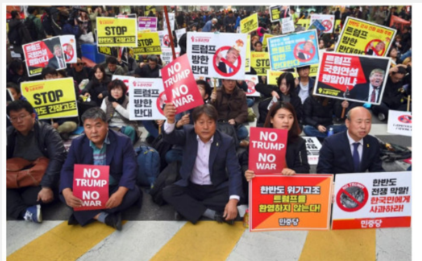
South Korean protesters hold up signs reading "No Trump, No War," during an anti-Trump rally in Seoul on Saturday, ahead of President Trump's visit to South Korea.

Με όλες τους τις διαφορές (και υπάρχουν), οι χώρες του λεγόμενου «υπαρκτού σοσιαλισμού», παρά και ενάντια τόσο στην αρχική επαναστατική δυναμική και τις δυνατότητες που ανέδειξε, όσο και ενάντια στην μαρξιστική κομμουνιστική στόχευση για χειραφέτηση της εργασίας και πλέρια εργατική κοινωνική δημοκρατία, κινήθηκαν με βάση το θανατηφόρο σχήμα «σοσιαλισμός=κρατική ιδιοκτησία+μονοκομματική εξουσία+δεσποτισμός στην παραγωγή+αποκλεισμός της εργατικής τάξης από την ελεύθερη πολιτική δραστηριότητα».