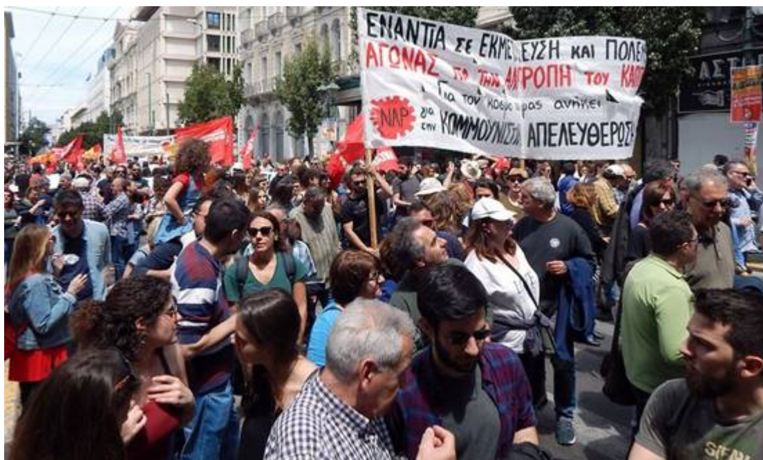
Με το σύνθημα των σωματείων στην κεφαλή,