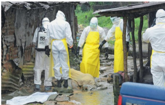
Υγειονομικό προσωπικό μέσα στα πλασπόνερα μεταφέρει εγκαταλεημένα πτώματα στη Λιβερία