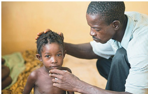
Ένα ηλιθιόπειο θύμα του ιού λίγο πριν εξεταστεί δέχεται τις φροντίδες του πατέρα του

ές του 1900 οι επιστήμονες εντόπισαν έναν παρόμοιο ιό, τον SIV, να έχει μολύνει ανθρώπους στην Κεντρική Αφρική προκαλώντας βλάβη στο ανοσοποιητικό σύστημα. Σύμφωνα με μελέτες του 2003, προσδιορίζεται η εμφάνιση του ιού σε ακτή των ΗΠΑ ήδη από το 1968 αλλά αυτό βεβαιώνεται 12 ολόκληρα χρόνια αργότερα. Το 1975 καταγράφονται περιστατικά στην Αφρική, ενώ από το 1977 μέχρι το 1979 υπάρχουν περιστατικά και θάνατοι σε πολλές χώρες. Μόλις το 1982 το CDC ορίζει το AIDS ως επικίνδυνη μεταδοτική αρρώστια που καταστρέφει το ανοσοποιητικό σύστημα, ενώ τα επόμενα χρόνια προσδιορίζονται όλες οι μέθοδοι μετάδοσης, αλλά και ο πλέον επικίνδυνος (με ποσοστό 20% στο σύνολο των μολύνσεων) με πολλαπλά θύματα μέσω της μετάγγισης αίματος. Η επιδημία έχει εξαπλωθεί παντού ενώ, σύμφωνα με τον ΠΟΥ, από το 1980 έως το 1997 μόνο στις ΗΠΑ υπήρχαν 641.097 περιστατικά, όταν την ίδια στιγμή σε ολόκληρη την Αφρική 620.000. Οι κάτοικοι της Αφρικής όμως, με τα φτωχά και συχνά απολύτως διεφθαρμένα συστήματα δημόσιας υγείας, δεν είχαν πρόσβαση στα ακριβά αντιρετροϊκά φάρμακα, ενώ οι πλούσιες χώρες παρείχαν και παρέχουν κυρίως ενημέρωση, ενέσεις και προφυλακτικά. Ακόμα και σήμερα οι εκκλήσεις αφρικανικών χωρών για φτηνά γενόσημα υπόκεινται σε φοβερούς περιορισμούς από τις μεγάλες πολυεθνικές του φαρμάκου.