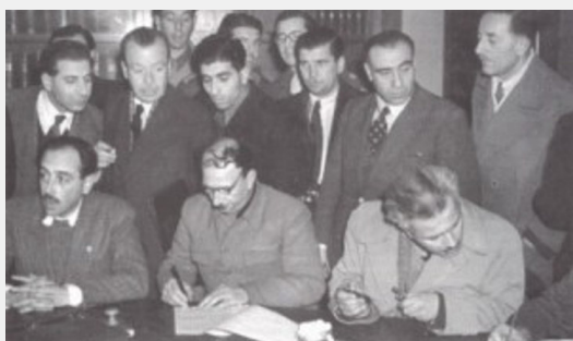
Η στιγμή της υπογραφής της Συμφωνίας της Βάρκιζας. Υπογράφει ο ΓΓ του ΚΚΕ Γιώργης Σιάντος

Στον παγκόσμιο πόλεμο το λαϊκό μέτωπο εξελίσσεται στην πιο συμβιβαστική μορφή του εθνικού μετώπου. Σ' αυτό έχει αντικειμενικά θέση η αστική τάξη στο σύνολό της (στο βαθμό που υιοθετεί αυτή την επιλογή), συμμαχική δύναμη λογίζεται συνολικά ο αντιφασιστικός άξονας, άρα και οι ιμπεριαλιστικές δυνάμεις (Αγγλία, ΗΠΑ, Γαλλία), ενώ προβλέπεται συγκρότηση κυβέρνησης εθνικής ενότητας. Απ' την προσωρινή εθνική κυβέρνηση με δημοκρατικές διαδικασίες θα εξασφαλιζόταν το πέρασμα στη λαϊκή δημοκρατία (λαοκρατία, «προχωρημένη αστική δημοκρατία»), που θ' αποτελούσε «σταθμό γρήγορου περάσματος προς το σοσιαλισμό».