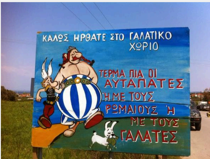
Σκουριές: Η Ελπίδα στους αγώνες!