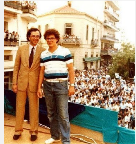
Α. Σαμαράς-Π. Καμμένος: Παλιοί συναγωνιστές, σημερινό αντίπαλοι. Αριστερά ο δεξιός, δεξιά ο αριστερός