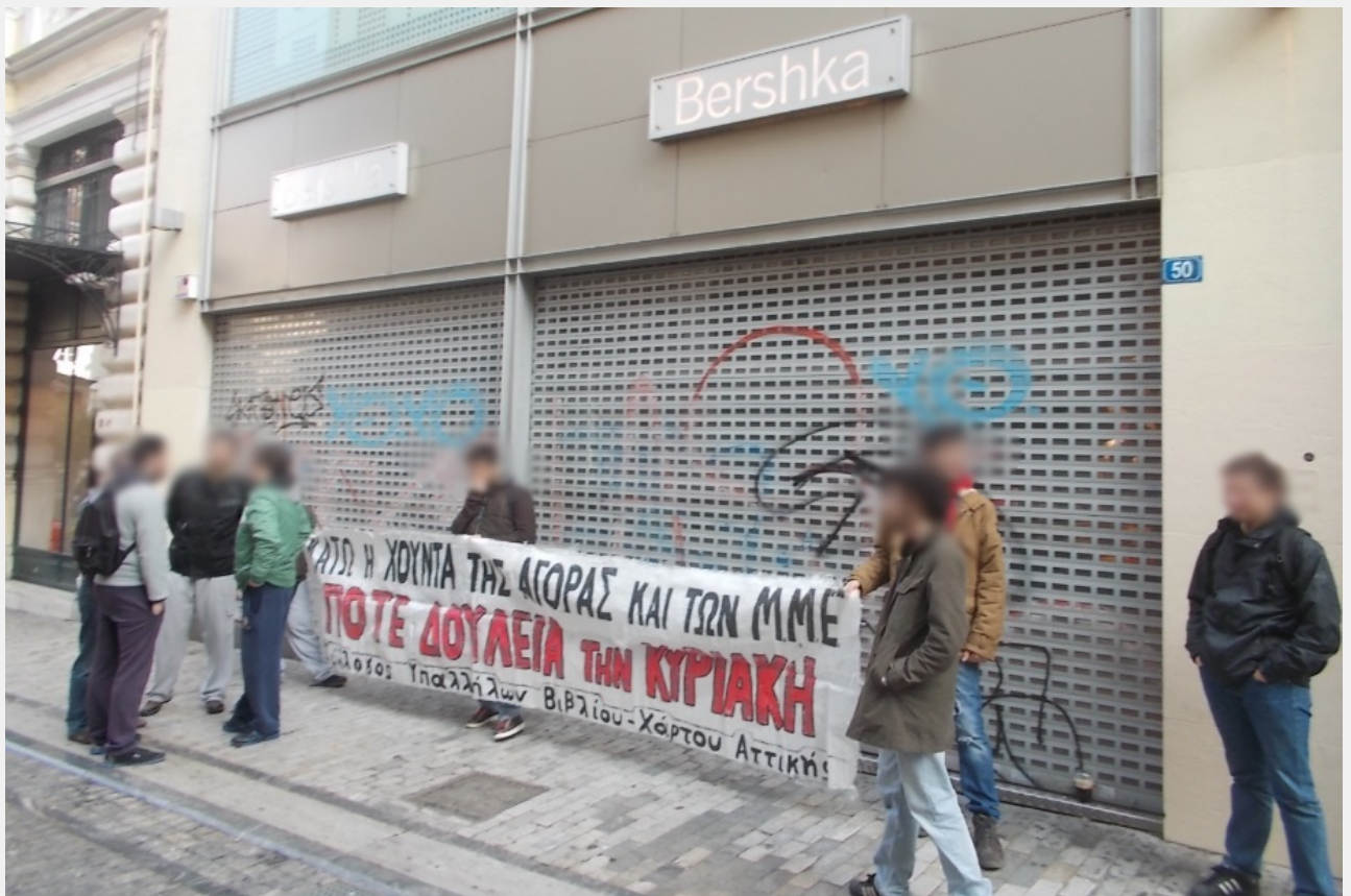
ΟΥΤΕ 52, ΟΥΤΕ ΚΙ 7 / ΚΑΜΙΑ ΚΥΡΙΑΚΗ ΤΑ ΜΑΓΑΖΙΑ ΑΝΟΙΧΤΑ