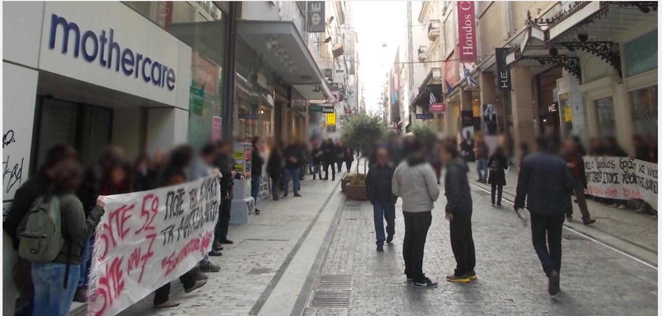
ΟΥΤΕ 52, ΟΥΤΕ ΚΙ 7 / ΚΑΜΙΑ ΚΥΡΙΑΚΗ ΤΑ ΜΑΓΑΖΙΑ ΑΝΟΙΧΤΑ