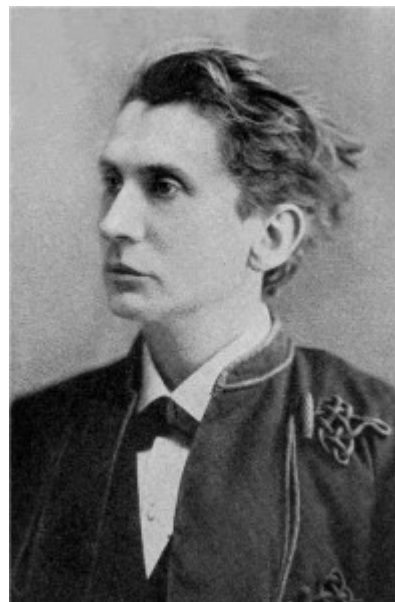
Λεοπόλντ Φον Ζάχερ-Μαζόχ

Επιζητούσε την κοινωνική καταξίωση διαδραματίζοντας ενεργό ρόλο στη ζωή της πόλης και διοργάνωνε θεατρικές παραστάσεις στις οποίες συμμετείχε και ο ίδιος ως ερασιτέχνης ηθοποιός.