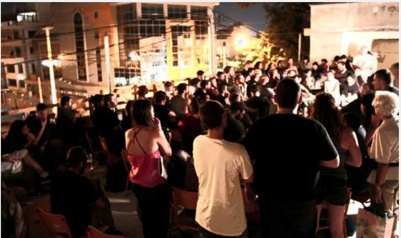
Από την εκδήλωση «Σεξισμός και ομοφοβία στο ελληνικό χιπχοπ»