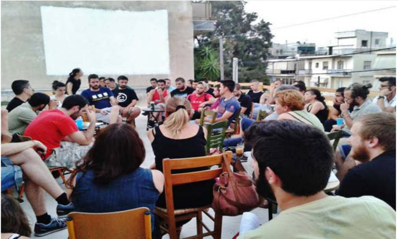
Εικόνα από την εκδήλωση «Η άνοδος του πολιτικοποιημένου χιπχοπ στις γειτονιές μας»

λέω ότι η πλειοψηφία αυτών των ιδεών διέπεται από την απόλυτη ορθότητα, αλλά σίγουρα δεν έχει να κάνει με τον φασισμό και τις εκφάνσεις του.