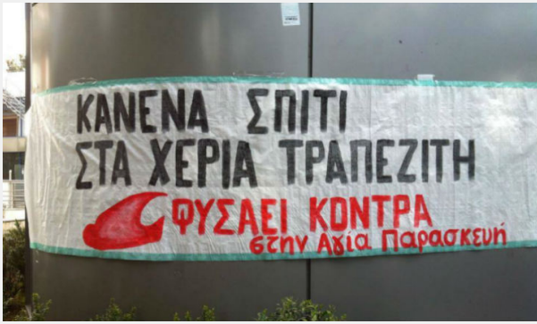
Ακύρωση πλειστηριασμού στο Χαλάνδρι 11/03

Δεν πραγματοποιήθηκε ο πλειστηριασμός της κατοικίας τρίτεκνης οικογένειας στο Χαλάνδρι. Πριν ένα χρόνο η Τράπεζα EUROBANK κατάσχεσε ένα μέρος του σπιτιού που ήταν χτισμένο με άλλη άδεια.