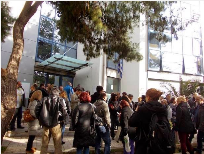
Ακύρωση πλειστηριασμού στο Χαλάνδρι 11/03

Αντίστοιχη κινητοποίηση είχε πραγματοποιηθεί την Τετάρτη 4/3 στο Λαύριο που απέτρεψε δύο πλειστηριασμούς, υπέρ της EUROBANK.