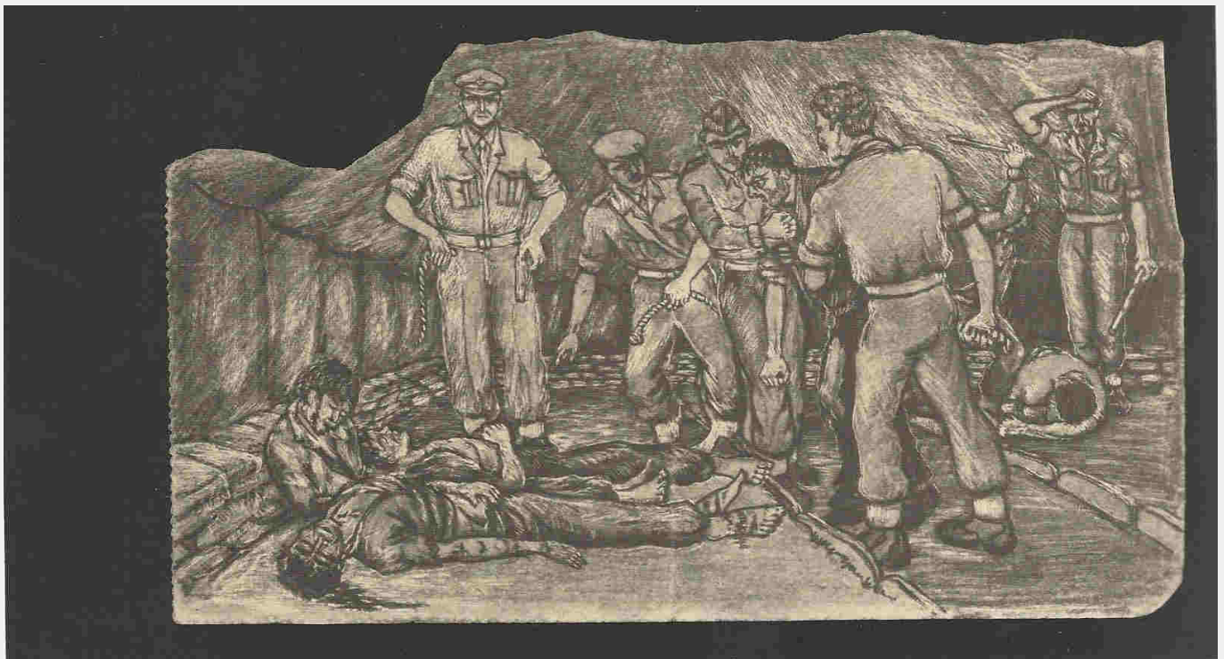
Μετά το μακελειό, ο Ιωαννίδης με τους αλφαμίτες μπρος στα αιμόφυρτα κορμιά εκβιάζουν για «δήλωση»: «Σκύψε κομούνα να ιδείς, τα τίναξαν οι πουτάνες. Η σειρά του τώρα, καθάριζε...» Σχέδιο του 1949.

Το σχέδιο που ακολουθεί, περιέχεται στο βιβλίο "ΜΑΚΡΟΝΗΣΟΣ" και είναι εκείνο για το οποίο ο δικτάτορας Ιωαννίδης μήνυσε και εξόρισε τον Γ. Φαρσακίδη: