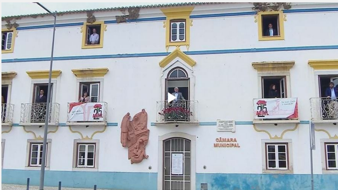
Λισαβόνα, 25 Απρίλη 2020: Ο λαός γιορτάζει την επέτειο της Επανάστασης των Γαρυφάλλων εν μέσω καραντίνας, τραγουδώντας από τα μπαλκόνια το “Γκράντολα, Βίλα Μορένα”