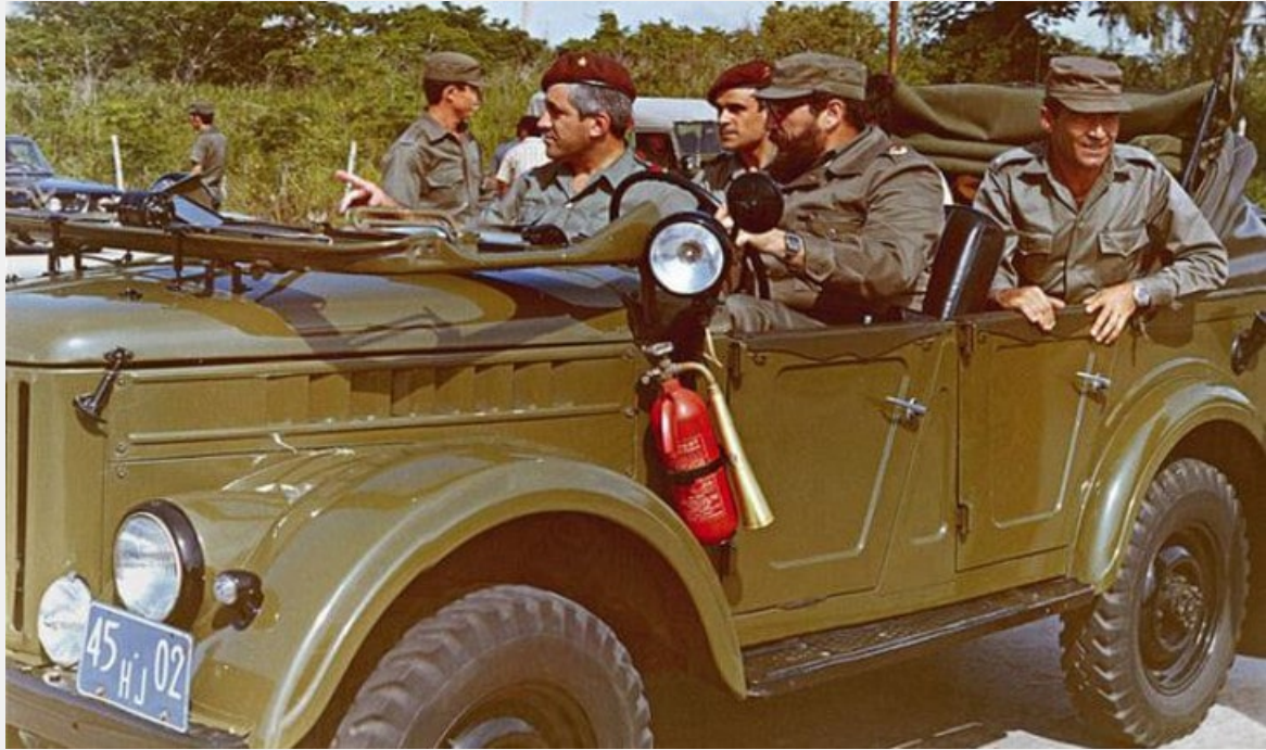
Ο Οτέλο Καρβάλιο και ο Φιντέλ Κάστρο στην Πορτογαλία