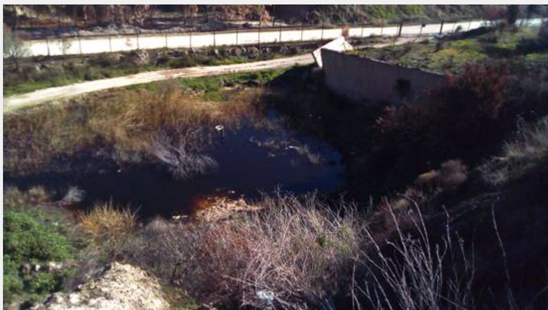
Λίμνη στραγγιδίων κάτω από τον Βιολογικό