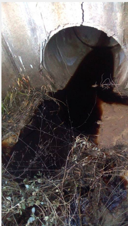
Έξοδος αγωγού ομβρίων