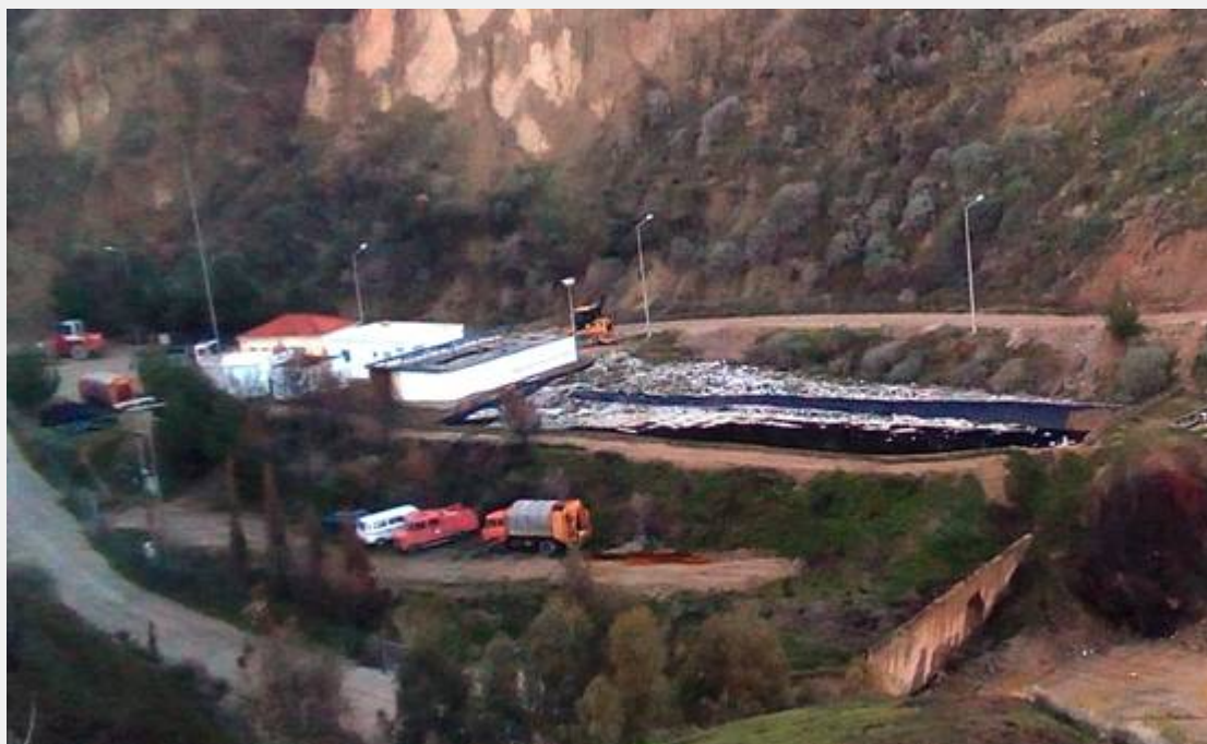
Ο Βιολογικός Καθαρισμός πλημμυρισμένος