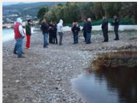
Στη θάλασσα, 28/10/2015