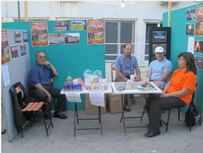
Φεστιβάλ Αναιρέσεις, 12_6