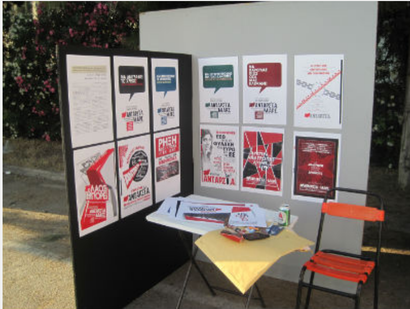
Φεστιβάλ Αναιρέσεις, 12_6