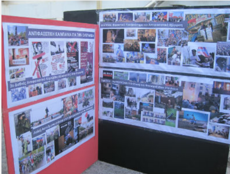
Φεστιβάλ Αναιρέσεις, 12_6