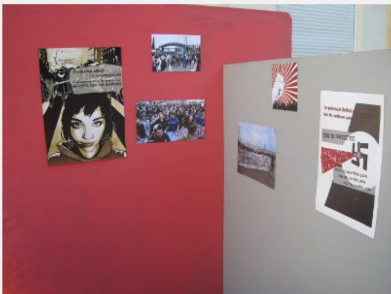
Φεστιβάλ Αναιρέσεις, 12_6