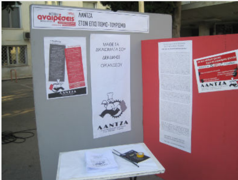
Φεστιβάλ Αναιρέσεις, 12_6