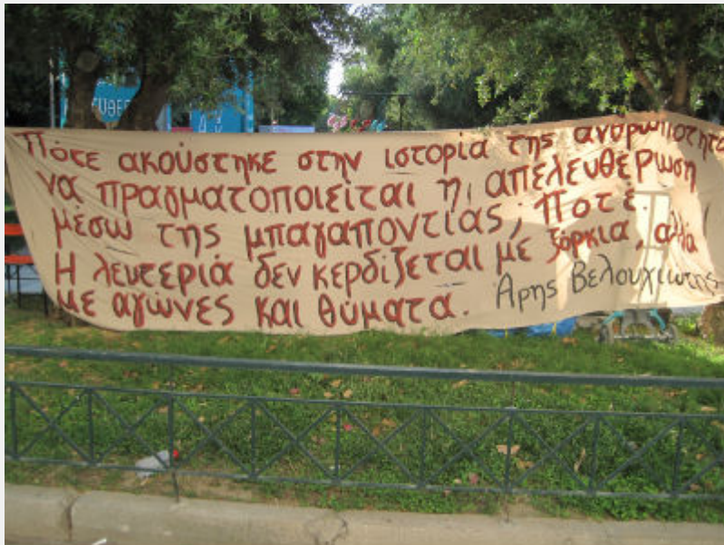
Φεστιβάλ Αναιρέσεις, 12_6