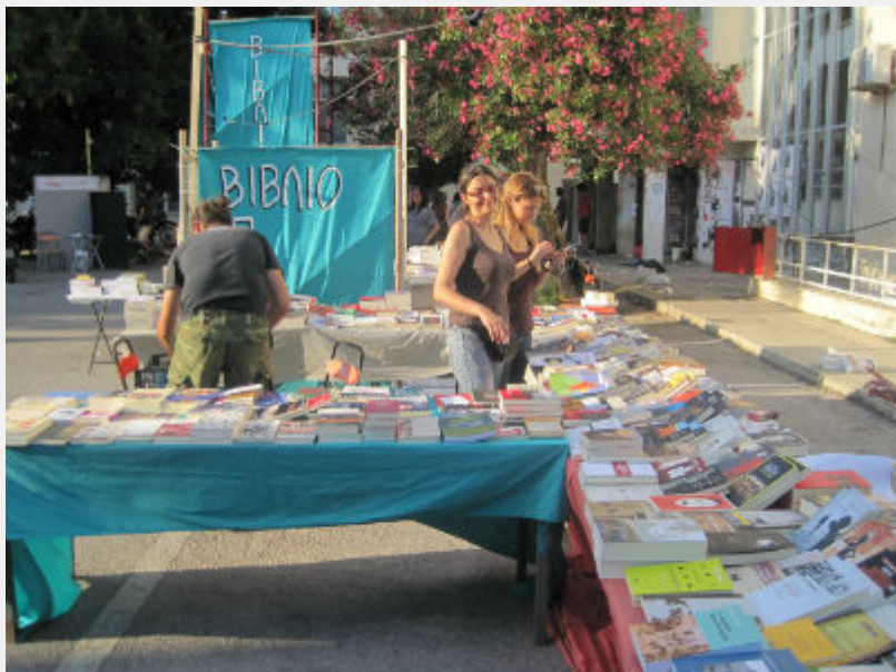
Φεστιβάλ Αναιρέσεις, 12_6