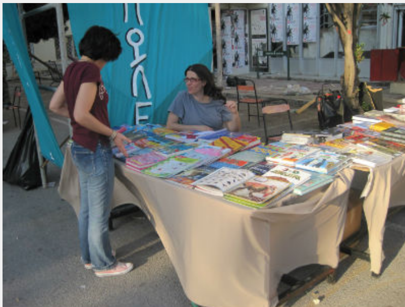
Φεστιβάλ Αναιρέσεις, 12_6