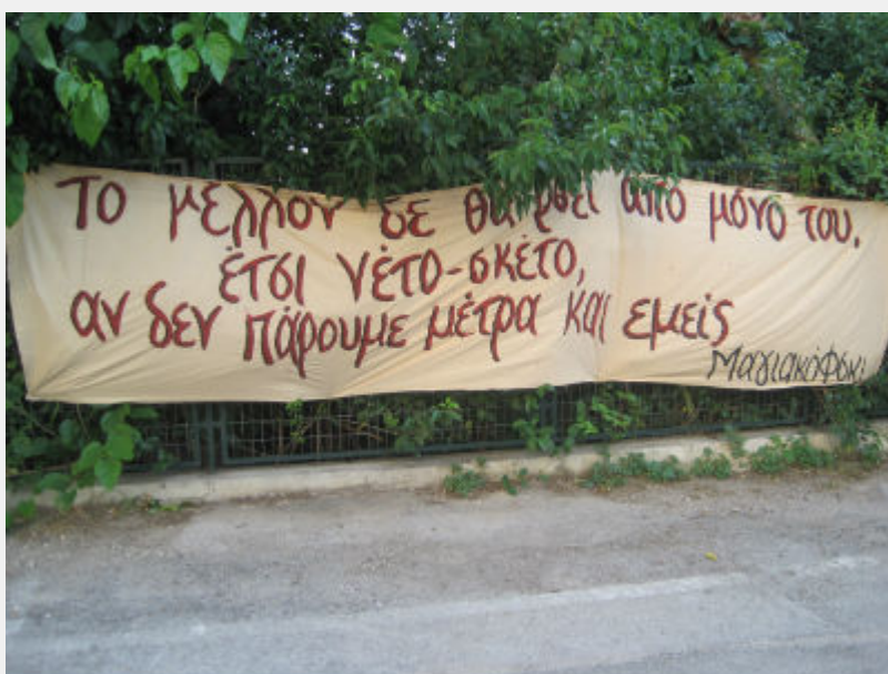
Φεστιβάλ Αναιρέσεις, 12_6