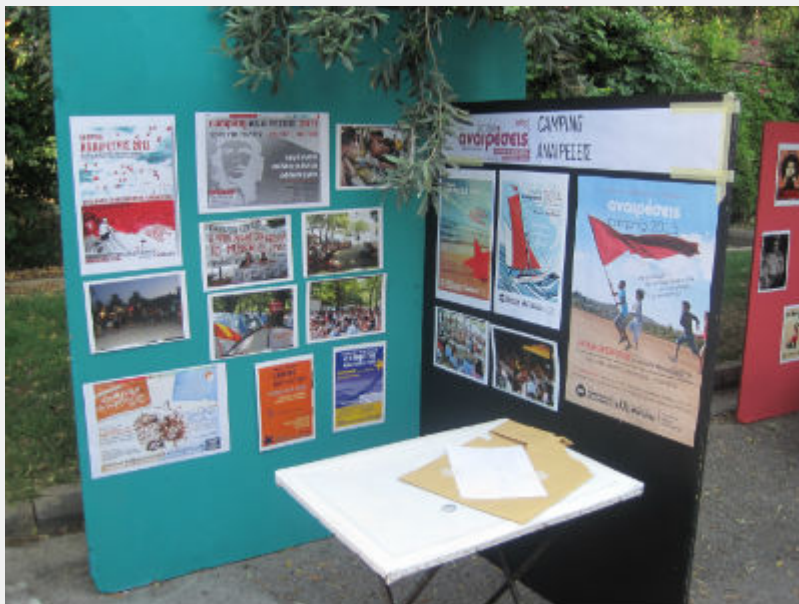
Φεστιβάλ Αναιρέσεις, 12_6