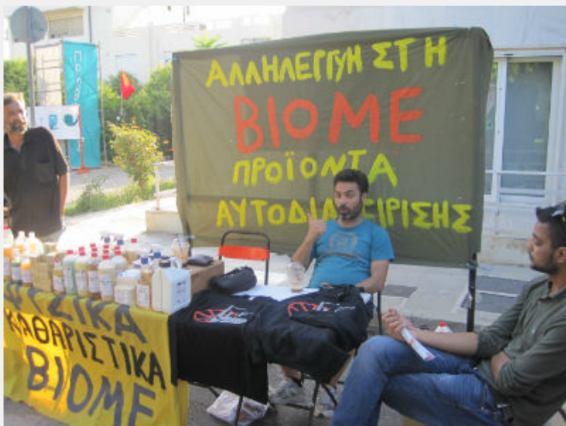
Φεστιβάλ Αναιρέσεις, 12_6