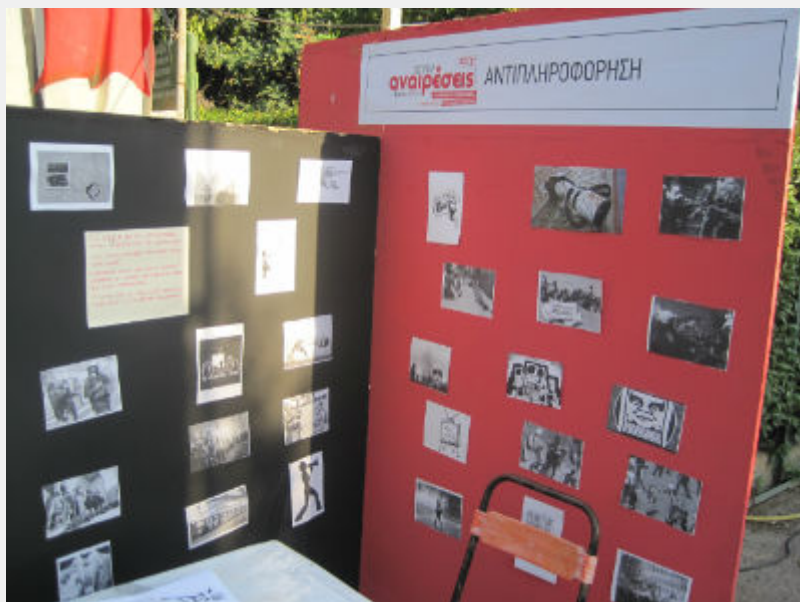
Φεστιβάλ Αναιρέσεις, 12_6

Στο περίπτερο των απολυμένων της Χαλυβουργίας, ποιήματα από το Σταύρο Δικαίο Φωνικάκο