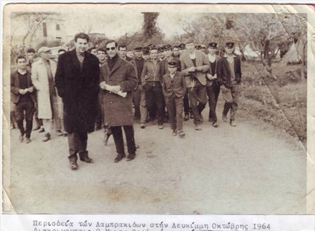
Περιοδεία των Λαμπρακιδων στην Λευκίμμη Οκτώβρης 1964 Διακονούνται: Ο Μίκης Θεοδωράκης

Τη Λευκίμμη, που ξέχασαν τόσο γρήγορα ότι αυτή τους εξέλεξε, ξέχασαν τα αποτελέσματα των τελευταίων δημοτικών εκλογών ; (ΚΚΕ 26%, ΣΥΡΙΖΑ 31% στο Α' και 60% στον Β' γύρο), ξέχασαν τα αποτελέσματα των ευρωεκλογών ; (ΣΥΡΙΖΑ 45%, ΚΚΕ 10%, ΑΝΤΑΡΣΥΑ 1,6%), ή μήπως ξέχασαν το δημοψήφισμα στο οποίο η Λευκίμμη δίνει ένα από τα συντριπτικότερα ποσοστά πανελλαδικά με 78,53% υπέρ του ΟΧΙ ?