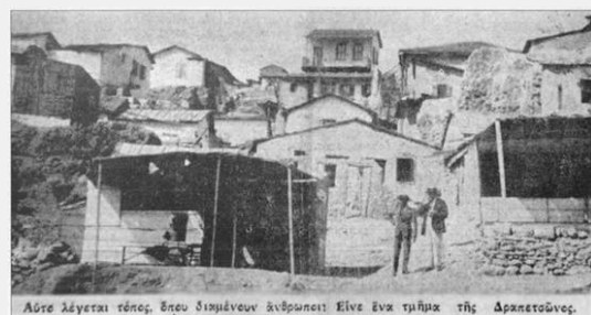
Αίστε λαγερταί τόπος, όπου διαμένουν άνθρωποι. Είναι ένα τμήμα της Δραπετσώνας.

Πάρ' το γεράνι μας, πάρ' το στεφάνι μας, στη Δραπετσώνα πια δεν έχουμε ζωή. Κράτα το χέρι μου και πάμε αστέρι μου, εμείς θα ζήσουμε κι ας είμαστε φτωχοί.