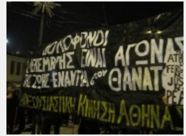
Πανό από την απογευματινή συγκέντρωση