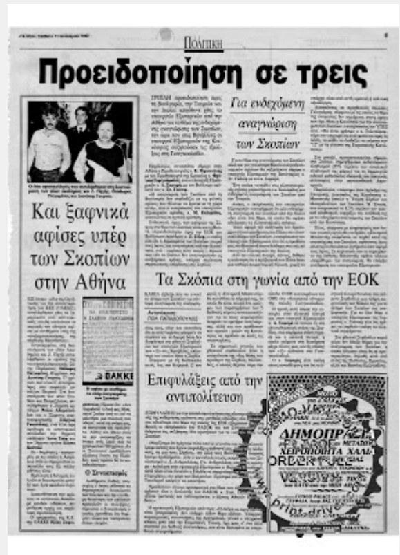
TA NEA, 11/1/1992

«Τα δύο μπλοκ των ληστών κυβέρνησης και αντιπολίτευσης... αυτοί που έχουν φερθεί με ψευτιά και θράσος απέναντι στον ελληνικό λαό, είναι εξίσου ψεύτες και θρασείες στις διεθνείς τους σχέσεις. Σκύβουν το κεφάλι στους ισχυρούς και ποδοπατούν τους αδύναμους... Έλληνες πατριώτες, δημοκράτες... τσακίστε τους πολεμοκάπηλους των τριών κομμάτων».