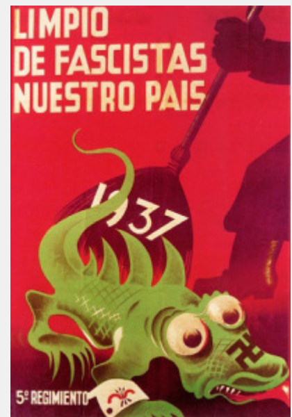
ΑΝΤΙΦΑΣΙΣΤΙΚΗ ΑΦΙΣΑ ΤΟΥ ΙΣΠΑΝΙΚΟΥ ΕΜΦΥΛΙΟΥ

Όμως, η ιδέα ότι στην μετάβαση προς την λαϊκή εξουσία δεν θα υπάρχουν καπιταλιστικές σχέσεις παραγωγής και καπιταλιστική ανάπτυξη είναι παράλογη. Θα ήταν ένας σκέτος αριστερισμός, αν δεν ήταν, ακόμη χειρότερα, μια ιδέα που πριμοδοτεί το μη σχέδιο -την αδράνεια- την ιδεολογική και κινηματική στασιμότητα, την άγωνα ταυτοτική περιχαράκωση. Ως τέτοια, είναι επικίνδυνη, όπως ακριβώς ήταν η συγκαλυπτική στάση του σταλινισμού, η οποία το 1936 κήρυξε τον «σοσιαλισμό» και την εξαφάνιση των ανταγωνιστικών αντιθέσεων, συγκαλύπτοντας την ταξική εξουσία της γραφειοκρατίας. Όποιος δεν παρουσιάζει καθαρά την κατάσταση, καταλήγει να ενισχύει, σε φάσεις όξυνσης της ταξικής πάλης, τελικά τον ταξικό αντίπαλο.